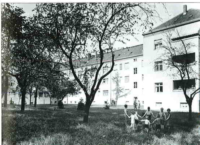
Historische Aufnahme des Innenhofs aus den 30er Jahren

Im Jahr 2001 wurden in einem aufwändigen Sanierungsprogramm die zentrale Heizungs- und Warmwasseranlage erneuert sowie moderne Bäder eingebaut. Neben diesen Aufwertungen im Baubereich garantiert vor allem auch der parkähnliche Innenhof, dass es sich in dieser Mariendorfer Wohnanlage des wbv gut leben lässt.