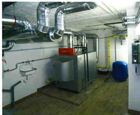
Blick in die neue Heizzentrale

stellten wir bereits im Bereich Niklasstraße/Ecke Ilsensteinweg in Zehlendorf 18 Wohnungen auf ein modernes Zentralheizungssystem um.